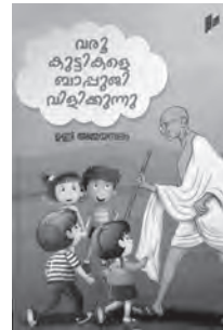
വരൂ കുട്ടികളെ ബാപ്പുജി വിളിക്കുന്നു