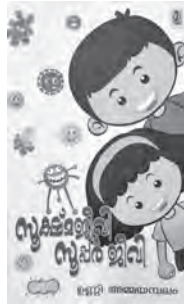
സൂക്ഷ്മജീവി സുപ്പർ ജീവി